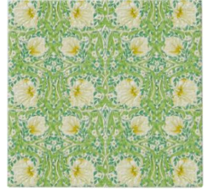
ヴィクトリアフラワー