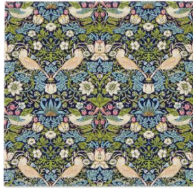
バード&ストロベリー