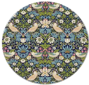
バード&ストロベリー