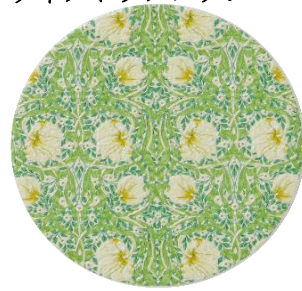
ヴィクトリアフラワー