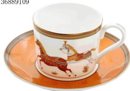
売れ筋 品番：37691 JAN:4560136889222